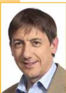
Jan Jambon Kamerlid

Jan Jambon: "Analyses, argumenten en cijfers. Dat zijn de sterkste wapens van de N-VA in elk debat. Of het nu gaat over de transfers naar Wallonië, het kostelijke koningshuis of infrastructuurwerken. Populisme en het diaboliseren van tegenstanders laten wij aan anderen over."