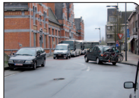
Als we de verkeersknoop willen ontwarren, moeten we rekening houden met goede mobiliteit én veiligheid.

neerschrijven dat de bestemming 'van onderuit' moet groeien. Nu spreekt men al van honderdduizenden euro's om het dak te herstellen. En het enige dat van onderuit groeit, zijn de planten die boven het dak van de hal uitkomen."