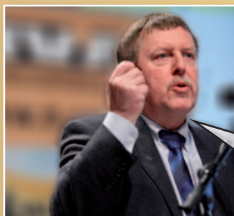
Siegfried Bracke N-VA-Kamerlid

"Ik stel keer op keer vast dat het onderscheid tussen CD&V, Open Vld en sp.a gewoon verdwijnt. Het zijn drie partijen die samen - en warmpjes - in het apparaat zitten. Kijk naar het debat over de gas- en elektriciteitsprijzen. Plots roept men energienetbeheerder Eandis uit tot vijand nummer 1. Laat me niet lachen. Wie bestuurt Eandis? Dat zijn 8 CD&V'ers, 4 sp.a'ers en 4 Open Vld'ers. Ook in die zin is de N-VA vandaag dé uitdager van het systeem."