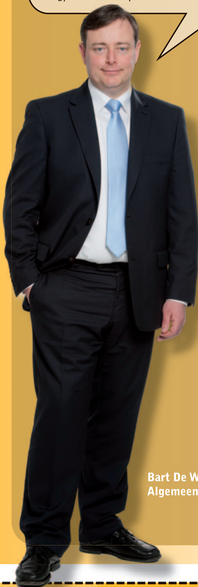
Bart De Wever Algemeen voorzitter N-VA

De N-VA kiest resoluut voor verandering. En ik vraag ook u om, samen met ons, die keuze te maken. Wil u de regering-Di Rupo weg, stem dan op 14 oktober op de N-VA!