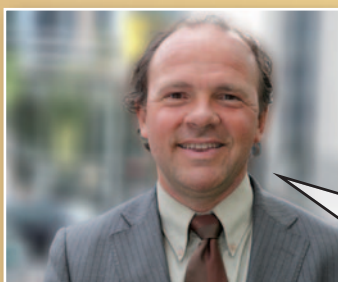
Philippe Muylers Vlaams minister van Financiën en Begroting

"Het Dexia-dossier hangt dit land als een molensteen om de hals. Als het verder fout gaat, stijgt de Belgische staatsschuld gigantisch. Ik vind dit gewoon hallucinant. De onbeantwoorde vragen stapelen zich ondertussen op. Maar Di Rupo zag geen beletsel om de Dexia-bestuurders kwijting te verlenen. Enkel het duidelijke 'neen' van de Vlaamse Regering deed de Belgische stem nog naar een 'onthouding' schuiven. Niet te begrijpen."