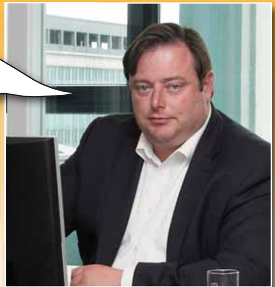
N-VA-VOORZITTER BART DE WEVER