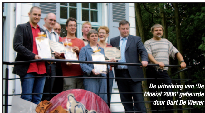
De uitreiking van 'De Moeial 2006' gebeurde door Bart De Wever

Kent u 'De Moeial'? De Moeial is de prijs die N-VA/PLE tweejaarlijks uitreikt aan verdienstelijke personen die Essen - van buiten de politiek - mee op het goede spoor zetten. Een traditie die in 2000 werd gestart.