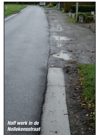
Half werk in de Nollekensstraat

Een stuk van Kraaienberg werd voor de helft overlaagd. In de Nollekensstraat bracht men op sommige plaatsen een betonstrook langs de kant aan, maar niet overal. Terwijl het asfalt daar even goed snel dreigt af te brokkelen.