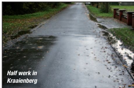
Half werk in Kraaienberg

Zo werd het fietspad tussen Hondsberg en Kloosterstraat aan de twee uiteinden verbreed en overlaagd, en in het midden helemaal niet. Pas na lang zoeken bleek het om een administratieve vergissing te gaan. Diezelfde reden kan niet worden aangehaald in Hemelrijk . Ook daar werd maar een deel van de straat verhard, naar