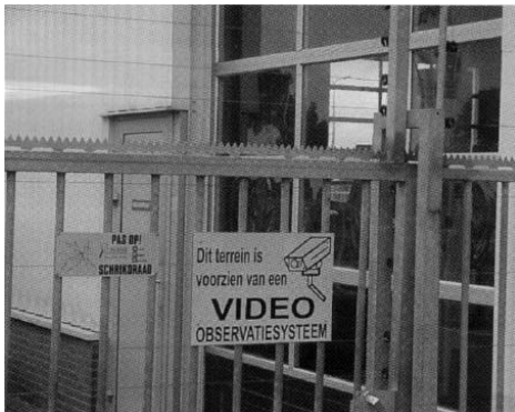
Welkom in de Hofstraat ?

Het wordt een rijkeluietto, midden de mensen : toegangsticket minstens 625.000 EUR!