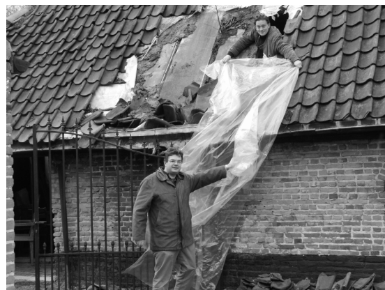
Het dak van de Kiekenhoeveschuur