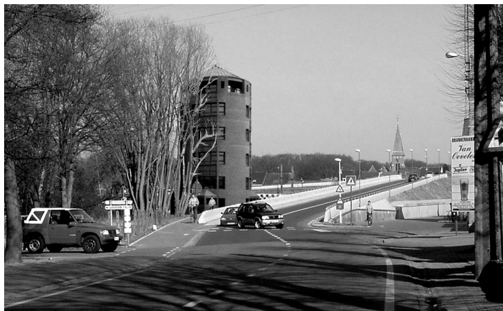
Ooit stond hier een watertoren, wij voorzien een woontoren : De Poort van Essen