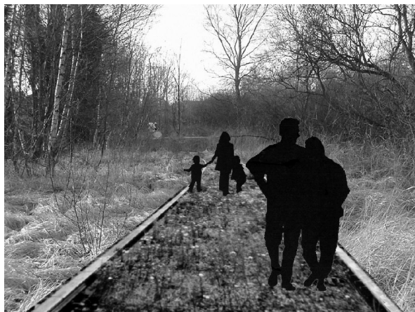
Het groen wordt bewaard in het wandelbos.

Tom : We willen ook heel verschillende woontypes naast elkaar plaatsen : kleine gezinswoningen, woningen voor alleenstaanden, wat grotere huizen, aangepaste woningen voor senioren... Er komen zowel koopwoningen als huurwoningen, waarvan een gedeelte via het OCMW zal worden verhuurd.