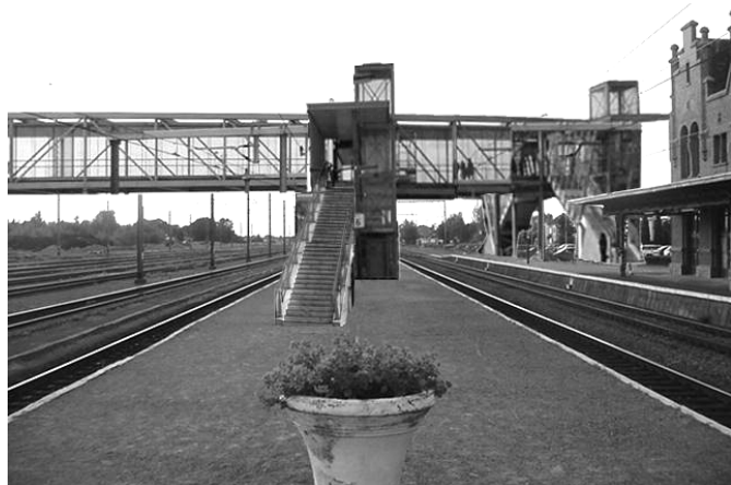
Via de passerelle kan je veilig over het spoor.

Dirk : Bovendien hoeft het niet eens zo duur te zijn. Een tunnel kost