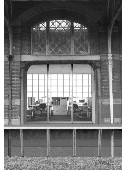
Aan het werk in de Spoorweghal : het kantoor staat al klaar !

Philip : Een aantal kosten kunnen de ondernemers op die manier ook gezamenlijk delen. Bovendien zal de aansluiting op het