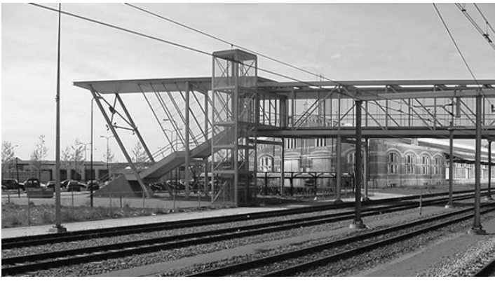
Rechtstreeks van Hemelrijk naar de Hemelrijklaan.